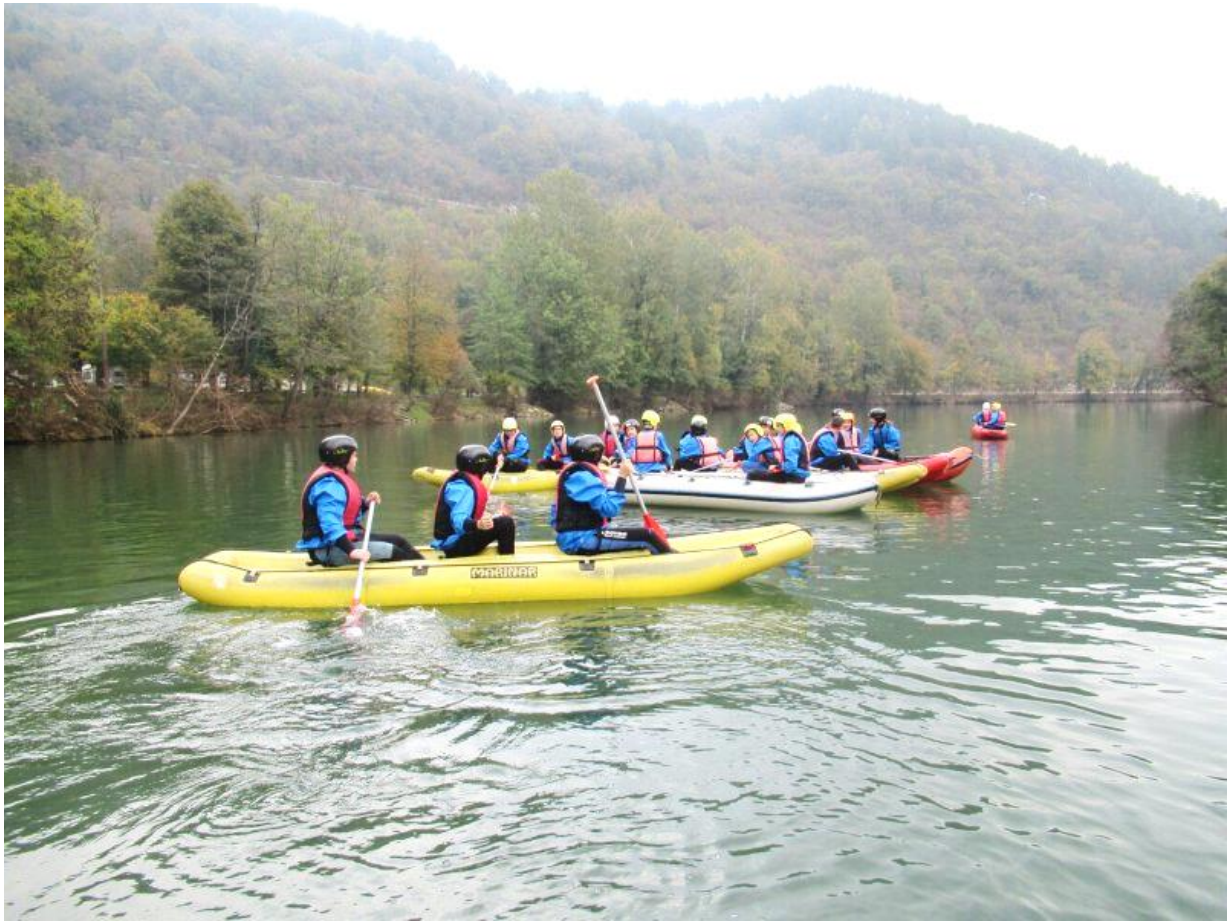
Učenci 5. razredov so imeli kulturni dan Otonova pustolovščina /DEKD/.