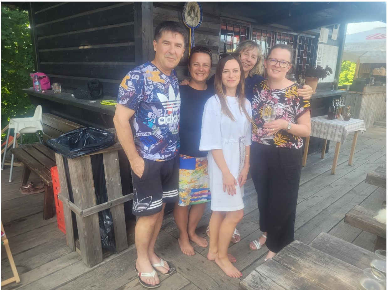
Zaposleni so bili v času poletnih počitnic na potovanju po Portugalski in Madeiri.