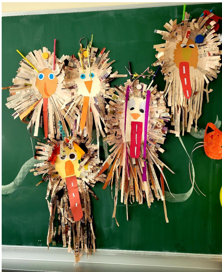
Dekoratívne maske so izdelali učenci 4.c razreda.

Učenci so odšli na počitnice, ki so bile obarvane s pustom. V tednu zimskih počitnic od 25. 2. do 6. 3. 2020 so uživali tako ali drugače. Tudi letos brez snega.